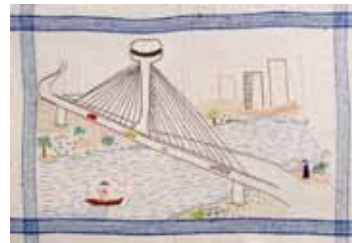
Bordado do Projeto Rios da Minha Terra, de Glaucy Carreiro Guimarães.

O livro “Bordar a Vida” está à venda no Bazar permanente da ACTC, localizado na Rua Oscar Freire, 1.463, de segunda a sexta-feira, das 8h às 17h, ou pelo e-mail lusiene@actc.org.br, à R$ 40,00 cada um.