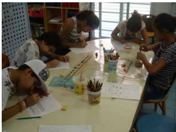
Crianças realizam atividades dirigidas para a avaliação Fonoaudiológica.

Uma vez por semana, a fonoaudióloga trabalha com o grupo de crianças do Brasileirinhos e ensina através de: exercícios com canudos, leitura interativa de histórias, orientação junto aos hábitos inadequados (uso de chupeta e mamadeira, sucção digital, respiração bucal, articulação de sons), atitudes para melhor qualidade de vida.