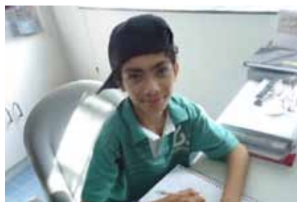
O reforço escolar propicia a consolidação do vínculo do jovem com a vida escolar.

Para os que participaram com frequência das aulas de reforço escolar, foram entregues kits contendo material pedagógico e livros paradidáticos.