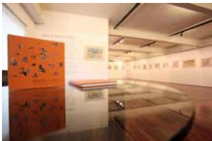
Exposição das obras do Projeto Rios da Minha Terra, na Galeria Estação, organizada para o lançamento do livro.