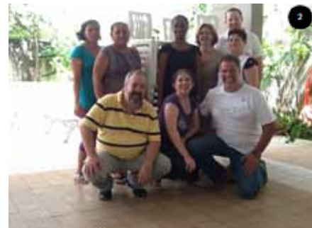
Foto 2 - Mães/acompanhantes, equipe da ACTC e diretores da Resgate Santista com as cadeiras doadas.