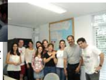
Encontro foi uma oportunidade de reunir todos e compartilhar experiências.