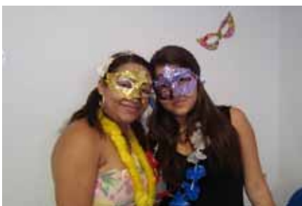
No carnaval, as mães/acompanhantes, adolescentes e funcionários da Unidade II receberam a todos com muita animação e alegria.

na Rua Oscar Freire. Os jovens fizeram uma visita à loja e puderam ver o belo trabalho inspirado no Carnaval de Venéza realizado pelos profissionais do ateliê.