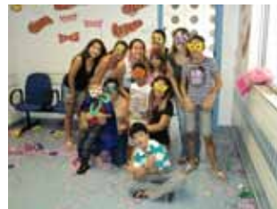
Crianças, adolescentes, mães/acompanhantes e funcionários se divertem ao som de muita música.

Além disso, todos os presentes se enfeitaram com máscaras, doadas pelo Ateliê das Máscaras, plumas, chapéus, perucas e colares para dançar e pular ao som das populares marchinhas de carnaval.