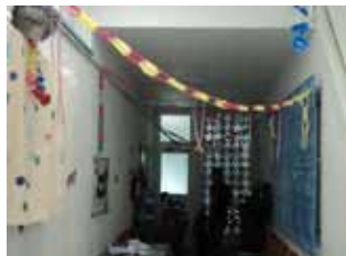
Unidade II foi toda enfeitada com confete, máscaras e cartazes para receber todos numa animada comemoração de Carnaval.