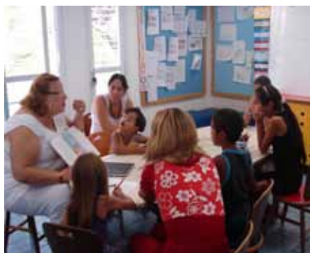
Junto com as crianças, as mães acompanham as instruções na Roda da Leitura.