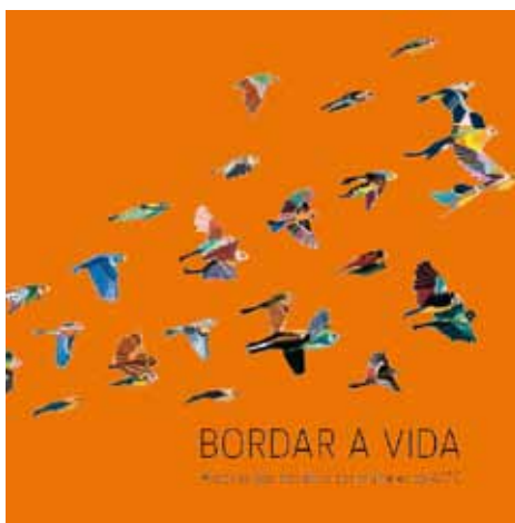
Capa do livro Bordar A Vida , lançado pela ACTC em 21 de março de 2012, na Galeria Estação.

Foi então que resolvemos chamar a assessoria externa da Escola Vera Cruz. Após seis meses, recebemos um diagnóstico: mães e crianças podem aprender, e muito, mesmo em condições adversas como as que vivenciavam naquele momento.